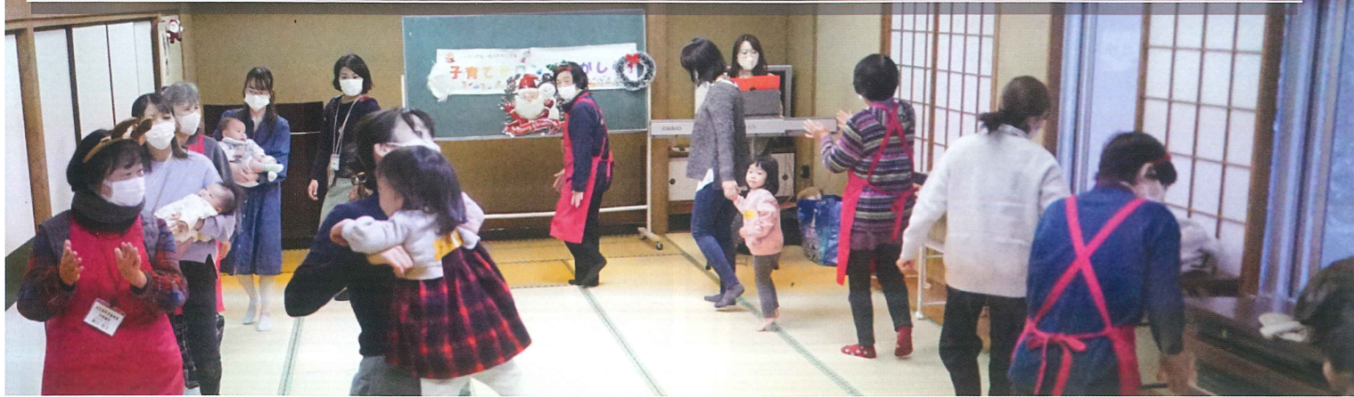
12月16日 2月16日 子育てサロン「こがしら」

10時より1時間半程度、小山田コミュニティーセンターで開催、たくさんの親子連れが参加されます。コロナ禍での活動になりますが、できる範囲で活動しております。令和4年度は6回開催することができました。