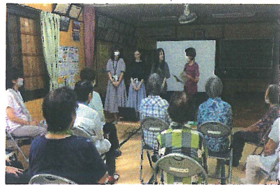
お達者クラブの様子