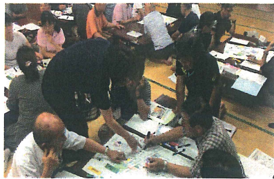
支えあいマップ作り研修