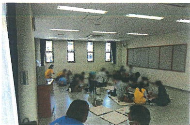
子育てサロンの様子