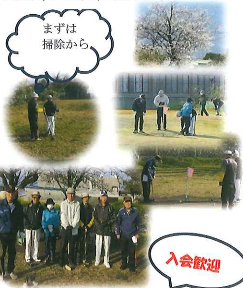
(令和5年度 吉野中央長寿クラブ主催の事業より)