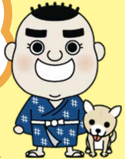
鹿児島市観光PRキャラクター 西郷どん

介護施設等 (特別養護老人ホーム、グループホーム、 デイサービス等)の登録施設で ボランティアをして、ポイントを 貯めましょう!!