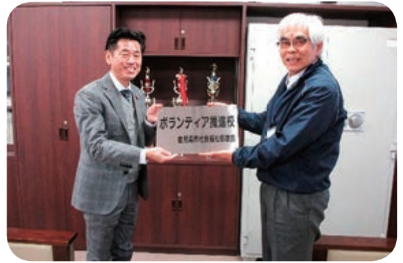
校長先生（左）へプレート贈呈

今回新たに、鹿児島高等特別支援学校を推進校として指定しました。指定以前から公民館の清掃やペットボトルキャップの収集を行うなどボランティア活動に熱心に取り組んでおられます。生徒の皆さんのボランティア活動がより充実し、今後も活躍されることを期待しています。