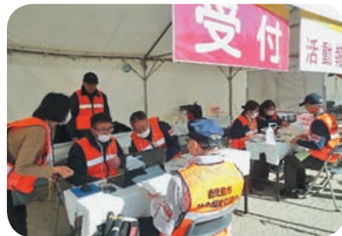
受信した活動報告をPCで確認中

令和6年1月13日（土）名山小学校と中央公園で開催された「第54回桜島火山爆発総合防災訓練」にあわせて災害ボランティアセンター設置・運営訓練を実施し、センターのICT化として、QRコードによるボランティア受付やスマートフォンを使った活動報告などの試験的な取組を行いました。