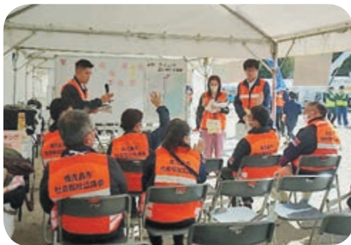
活動先のマッチング