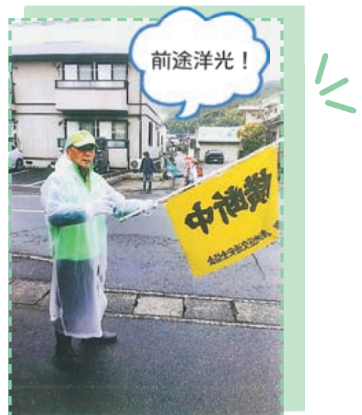
<子供達の安全を見守っています>

まだ途 みち なかばですが、これからも「夢」をもってゆくつもりです。前途洋“光”（※）