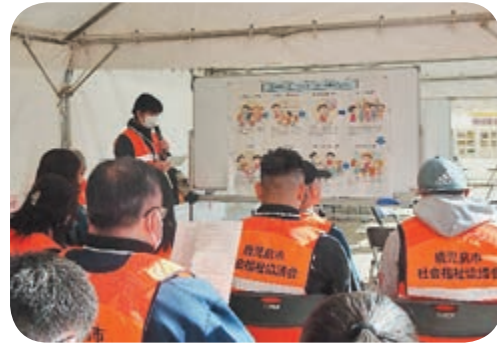
活動前のオリエンテーション