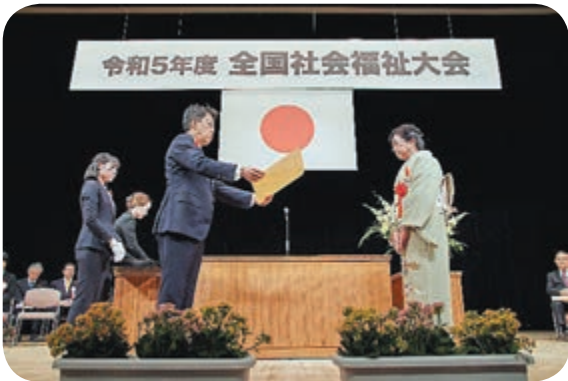
全国福祉大会（東京）での代表登壇の様子