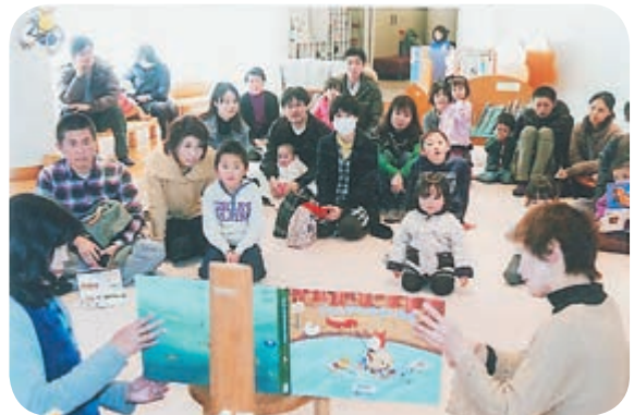
読み聞かせ活動の様子