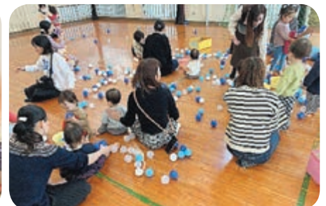
児童施設でのボランティア体験の様子