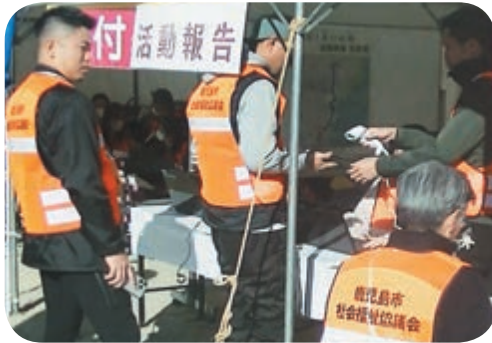
QRコードによるボランティア受付