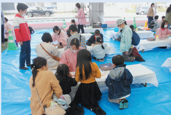
キッズ広場（親子交流遊び）