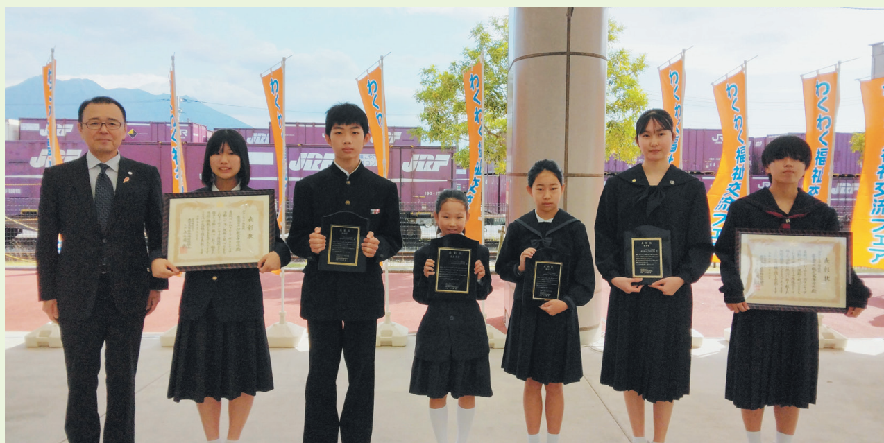
被表彰校を代表してご出席された皆さん

令和5年11月12日(日)に“かんまちあ”で開催された「第10回わくわく福祉交流フェア」にて、「令和5年度ボランティア推進校表彰式」を行いました。