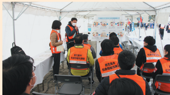
活動内容の説明（オリエンテーション）