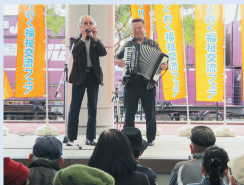
活動発表（ボランティアグループさわやか会）