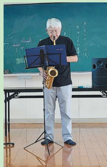
「お達者クラブ」での演奏の様子

しかし、昨年4月からは少しずつ活動できる環境になり、現在は鹿児島市の保健所が推進している「健康体操(お達者クラブ)」の開催時にお邪魔し、昭和・平成の懐メロや唱歌の歌詞カードを配布して、サックスの演奏に合わせて楽しく皆さん方に歌ってもらっています。また、他にも「ブルースター倶楽部」という12名で編成する「おやじバンド」にも加入しており、これからは慰問演奏や地域のイベント等へも音楽活動の場が増えていくものと期待しています。