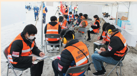
仮想避難者（聴覚障害者）からのニーズ調査

災害ボランティアセンターでは、被災直後のボランティアニーズの調査、市内外からのボランティアの受付やボランティアへの活動内容の説明、ボランティアのマッチング等を行います。