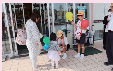
街頭募金運動の様子