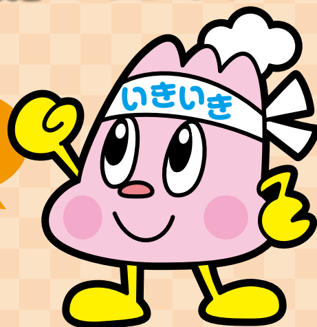
イメージキャラクター いきいきさん

健診などの 健康づくり活動 や 施設等での ボランティア活動 で、 「いきいきポイント」をためましょう!!