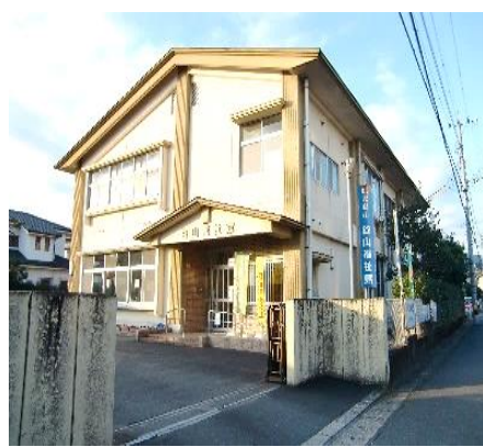
《令和4年度の利用状況》