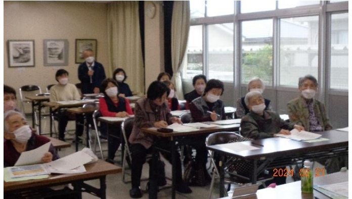
みなさん熱心に聞き入っておられました