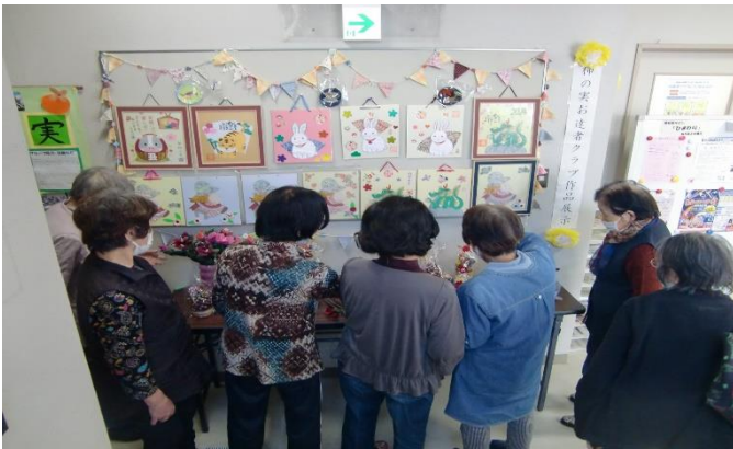
柿の実お達者クラブの作品展示