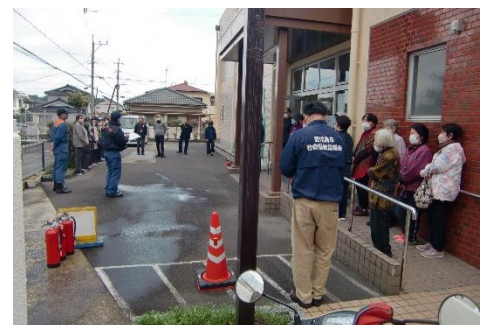
谷山分遣隊からの説明