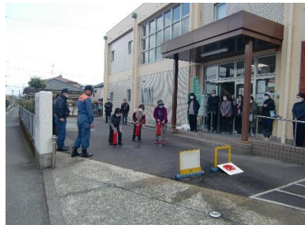
水消火器を使っての消火訓練