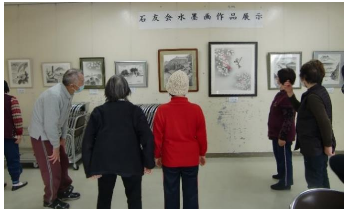
水墨画（石友会）の作品展示