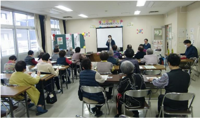
社協出前講座の様子

イベントにご協力いただいた西谷山校区社協、西谷山地区民児協、鹿児島市食改西谷山ブロックや、石友会（水墨画）・柿の実お達者クラブの出品者の皆様に改めて感謝申し上げます。