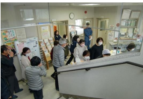
室内から避難の様子

2月10日、南消防署谷山分遣隊職員立合いの下、福祉館2階湯沸室から出火したとの想定で、館内放送・避難・通報訓練を行いました。当日は、カトリア元気クラブ、西谷山地区民児協の会員の皆さんにも参加いただき、火災の発生状況や火気取扱いの注意点など説明を受けた後、水消火器を使っての消火訓練を行い、消火器の操作手順の確認を行いました。地域や職場、あらゆる機会を通じて、訓練を重ねていく事が大事だと感じました。